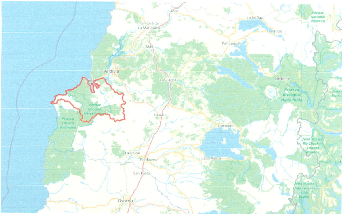
Figura 1. Localización de la comuna en el contexto regional